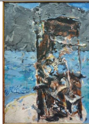
Plažni bar akrilik na platnu 70 x 30