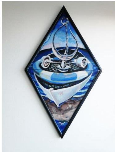
Camac akrilik na platnu 100 x 50