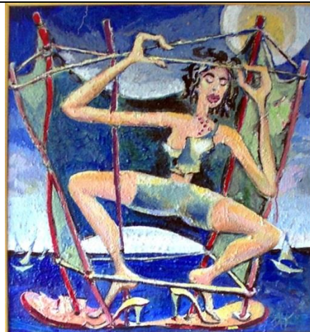
Veštica akrilik na platnu 80 x 80