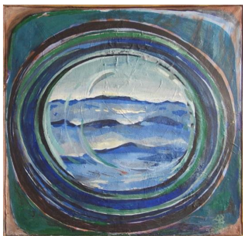
Pod palubom akrilik na platnu 50 x 50