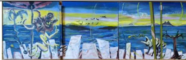
Majka i dete akrilik na platnu 40 x 130