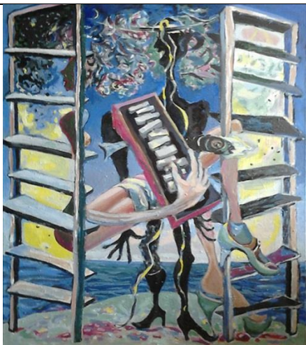
Vracara akrilik na platnu 120 x 100