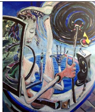
Vremeplov 120 x 100 akrilik na platnu