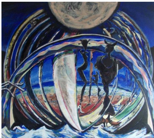
Kamp 126 x 137 akrilik na platnu