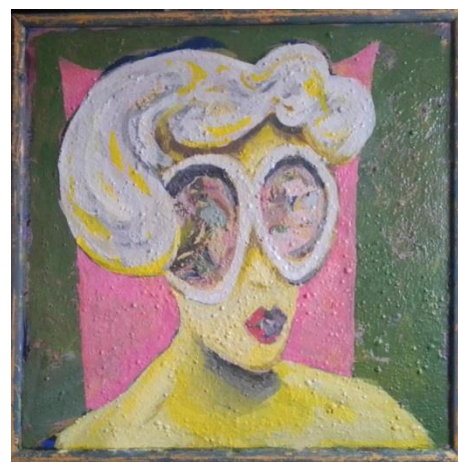
Blondy akrilik na platnu 60 x 60