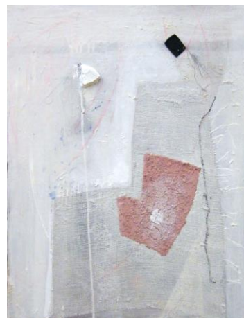
Naziv slike: Zmajevi Dimenzije: 54 x 41,5 cm Godina:2019.