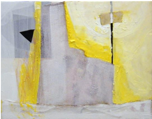
Naziv slike: Reaktor Dimenzije: 41,5 x 54 cm Godina:2019.