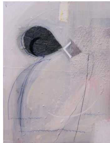
Naziv slike: Vektor i zmaj Dimenzije: 54 x 41,5 cm Godina:2019.