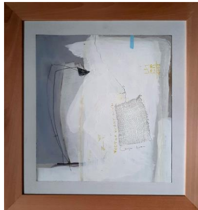
Naziv slike: Vector vent down Dimenzije 30x 30 cm Godina 2020.