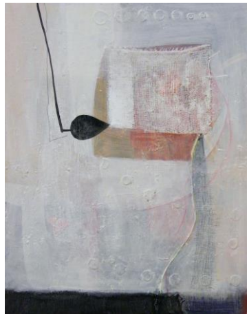
Naziv slike: Jedno drugo Dimenzije: 54 x 41,5 cm Godina:2019.