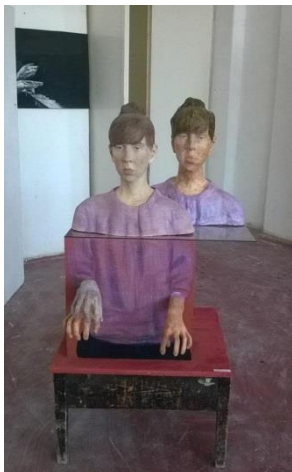
Naziv: „Amarcord“, 2015. Dimenzije: 98x52x50cm Tehnika: terakota, staklo, papir-maše.