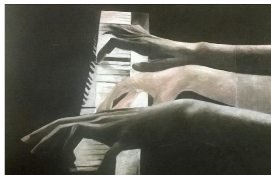
Naziv: „Bez naziva“, 2016. Tehnika: kombinovana.