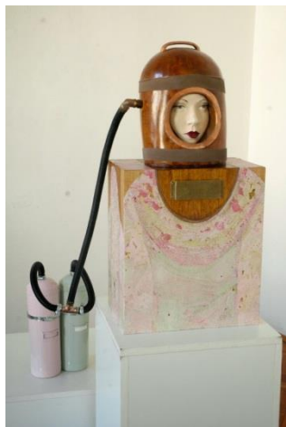
Naziv: "Diving/Divine", 2014. Dimenzije: 72x35x37cm Tehnika: drvo, metal, papir.