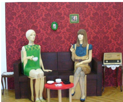
Naziv: They hated to spread gossip... , 2007