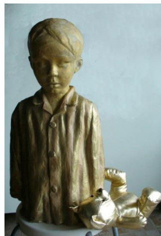
Naziv: "Golden boy", 2010. Dimenzije: 58x20x29cm Tehnika: drvo, piljevina, papir-maše.