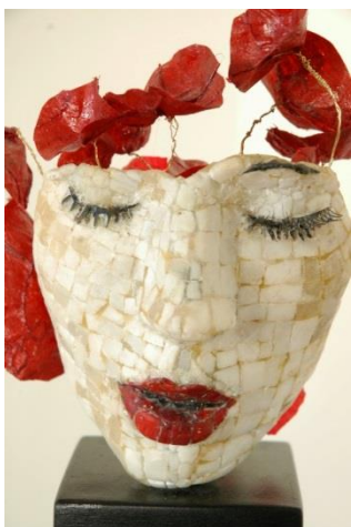
Naziv: "Inner beauty?!?", 2014. Dimenzije: 26x12x12cm Tehnika: mozaik (mermer, smalti)