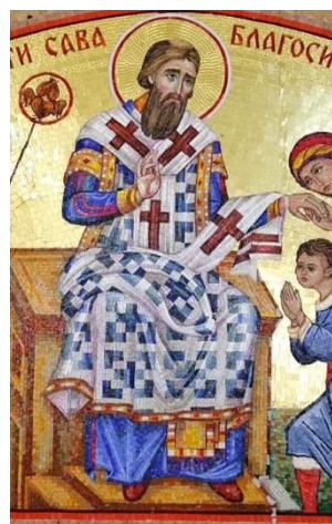
Naziv: „Sv. Sava blagosilja Srpčad“, (deo mozaičke kompozicije), crkva Sv. Save, Indija, 2022.