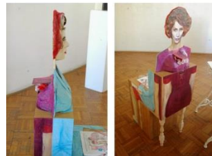
Naziv: Id vs Ego, 2014.