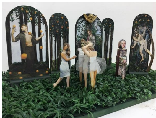
Naziv: "La Primavera", 2017. Dimenzije: 35x80x50cm Tehnika: asemblaž.